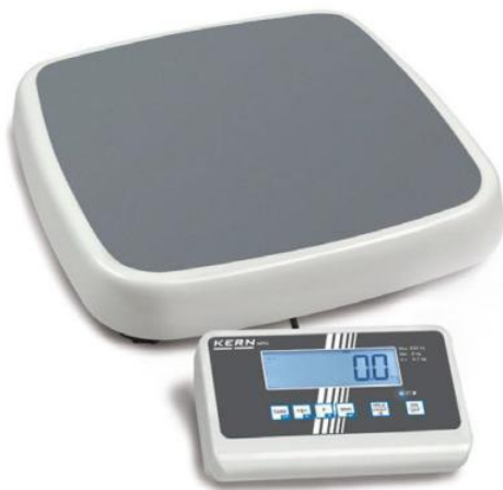
MPC 250K100M, MPC 300K-1M