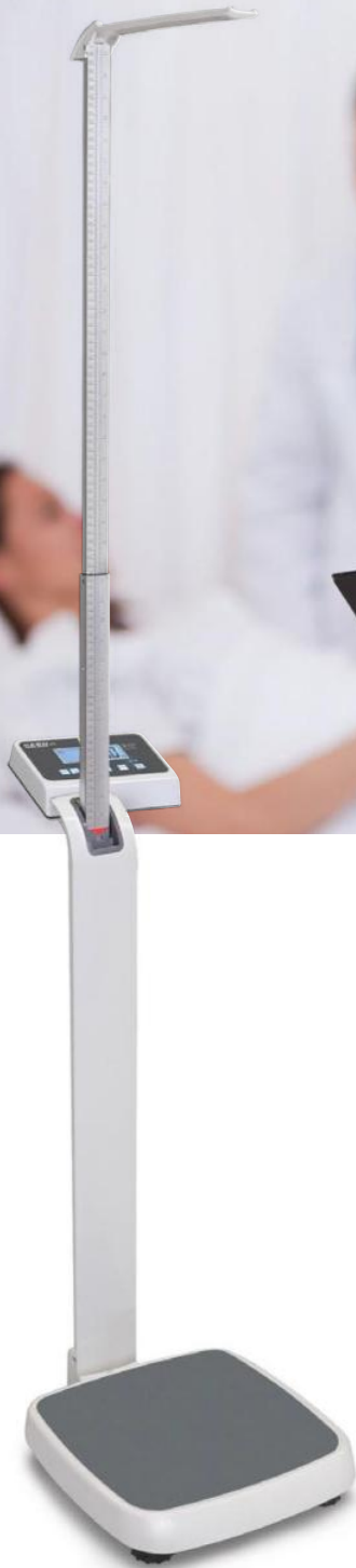
MPE-HM mit Stativ und Größenmessstab