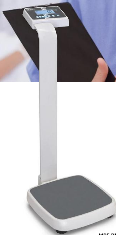
MPE-PM mit Stativ